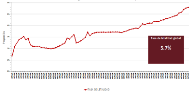
Gráfico 2. Tasa de letalidad* global de casos nuevos de COVID-19 por SARS-CoV-2

• Hasta la fecha, se han reportado casos en 210 países , notificados en las seis regiones de la OMS (América, Europa, Asia Sudoriental, Mediterráneo Oriental, Pacífico Occidental y África).