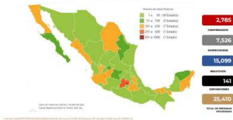
Mapa de México con los casos confirmados, negativos y sospechosos a COVID-19